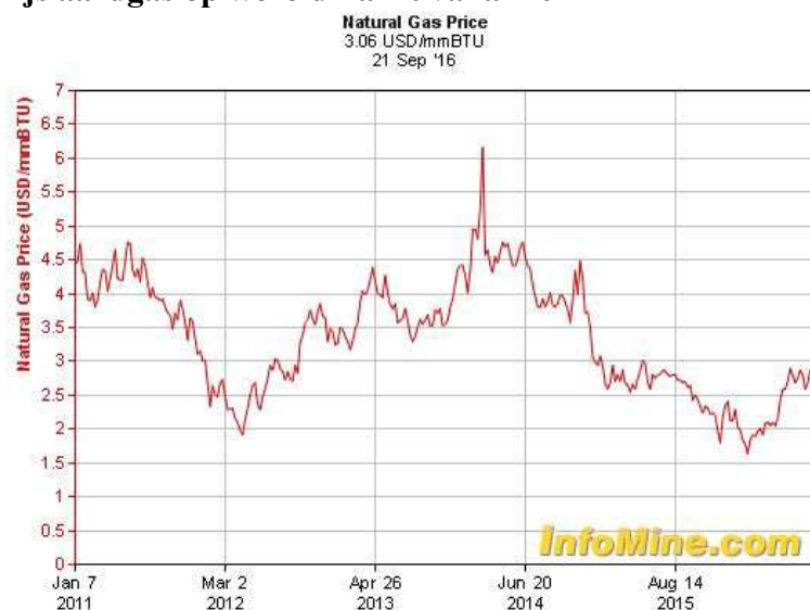
Figuur 1 Prijs aardgas op wereldmarkt vanaf 2011